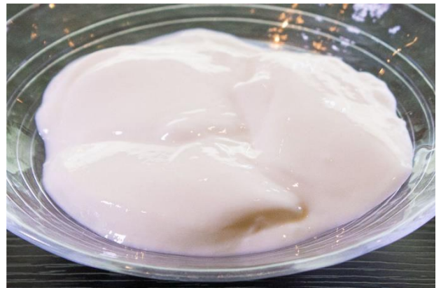
絹の様になめらかなくちどけ 杏仁豆腐 ¥248 (税込¥267.84)

【発売地域】 沖縄県内のセブン・イレブン店舗 ※一部店舗ではお取り扱いが無い場合がございます