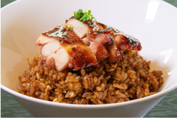
炭火焼鳥とねぎ油薫る 炭火焼チキンの黒炒飯 ¥550 (税込¥594)