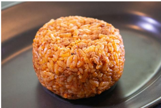
そそるラー油・花椒・甜面醬 花椒香る赤い麻辣チャーハン ¥165 (税込¥178.20)