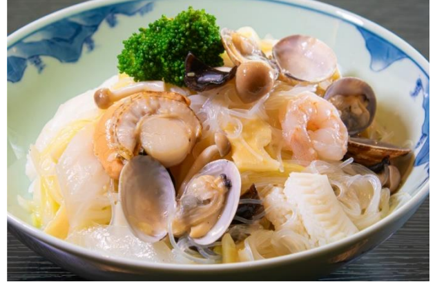
魚介の香り、旨味たっぷり 海の幸香る白い中華丼 ¥580 (税込¥626.40)